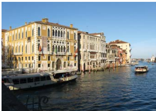
Канале Гранде – парадный фасад Венеции