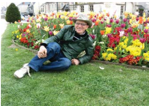
Амбуаз. Хорошо по- лежать на травке...