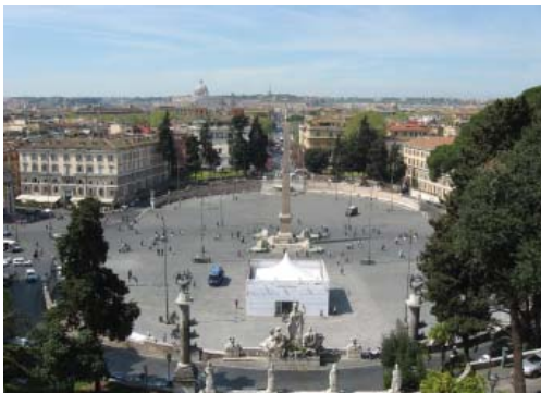
Рим. Пьяцца дель Пополо