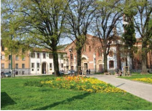
Милан. Церковь Сан Эусторджио