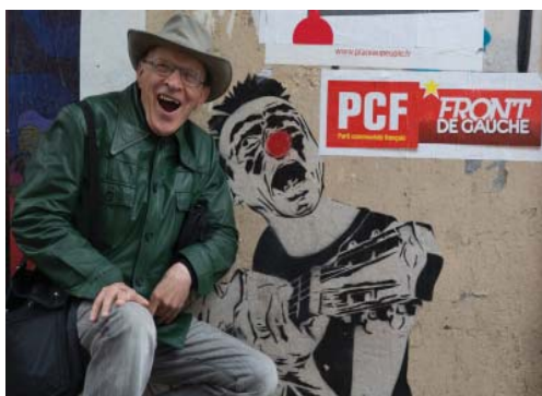
Париж. Голосуйте за левый фронт!