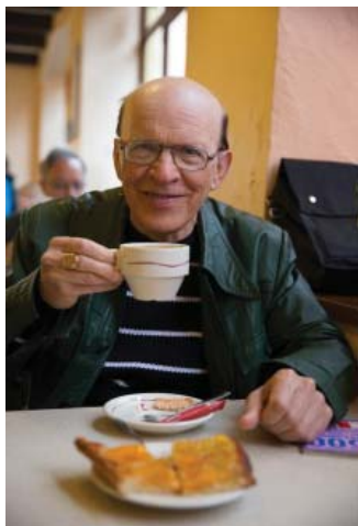
Чашечка капучино на завтрак