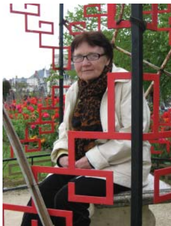
Набережная Луары: минутка отдыха