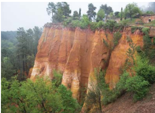
Охряные скалы Рус- сийона