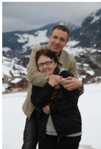
Верхняя Савоя: внизу – весна, а здесь – зима