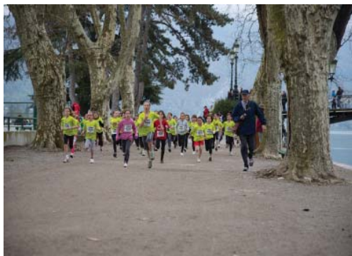
Анси: Весенний марафон