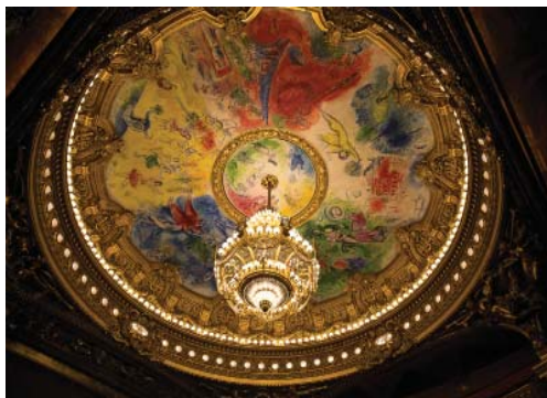
Дворец Гарнье – плафон Марка Шагала