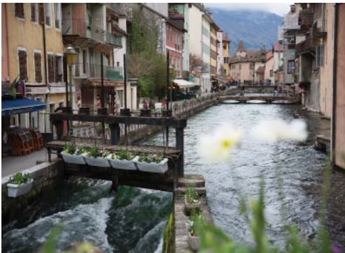
Анси – альпийская Венеция