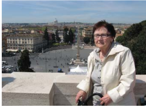
Рим. Пьяцца дель Пополо – площадь народа