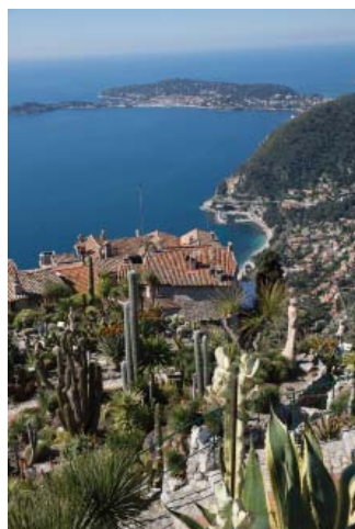
Вид на море из сада эк- зотических растений (Эз)