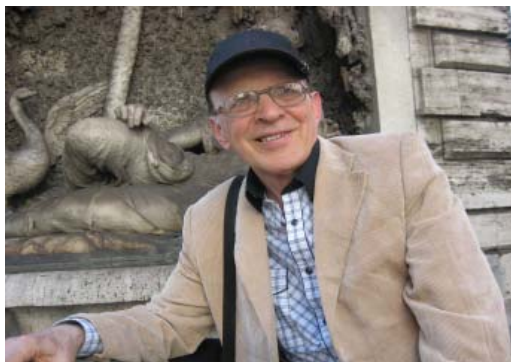
Рим. На площади «Четырех фонтанов»