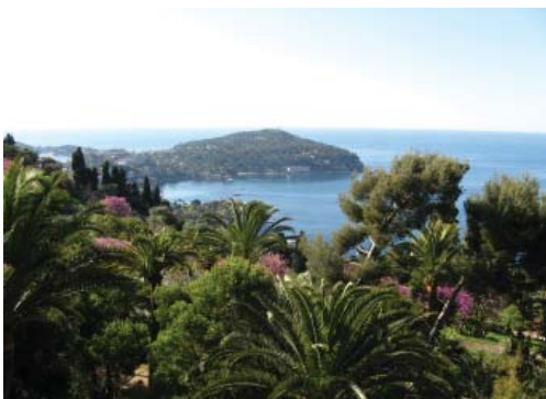
Лазурный берег близ Ниццы