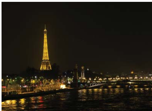
Полночь в Париже