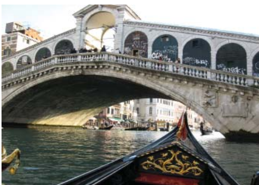
Впереди по курсу — мост Риальто