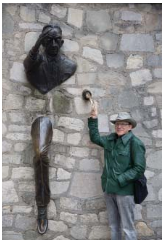
Человек, идущий сквозь стену