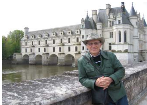
Шенонсо – замок на реке