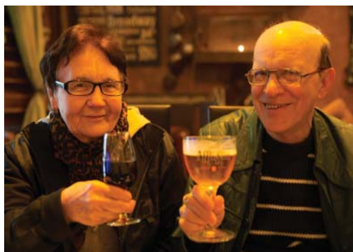
Гренобль. Вино и пиво — это диво...