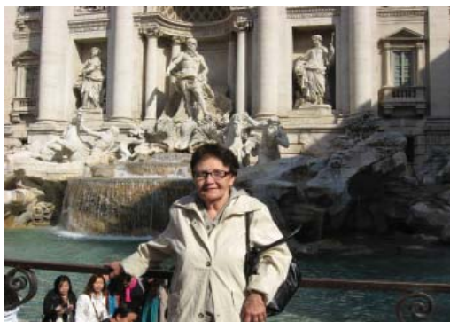
У фонтана Треви