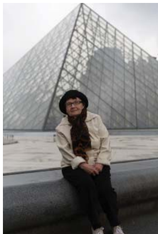
У пирамиды, веду- щей в Лувр