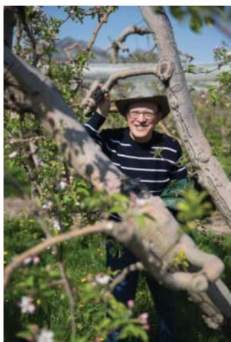
Яблони в цвету, какое чудо...