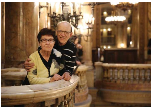
Париж. В театре «Гранд-Опера»