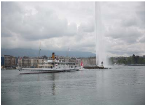
Фонтан «Же-д'О» в Женеве