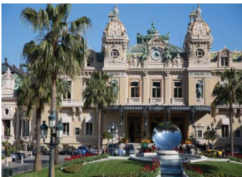
Здесь бывал Джеймс Бонд – казино Монте-Карло